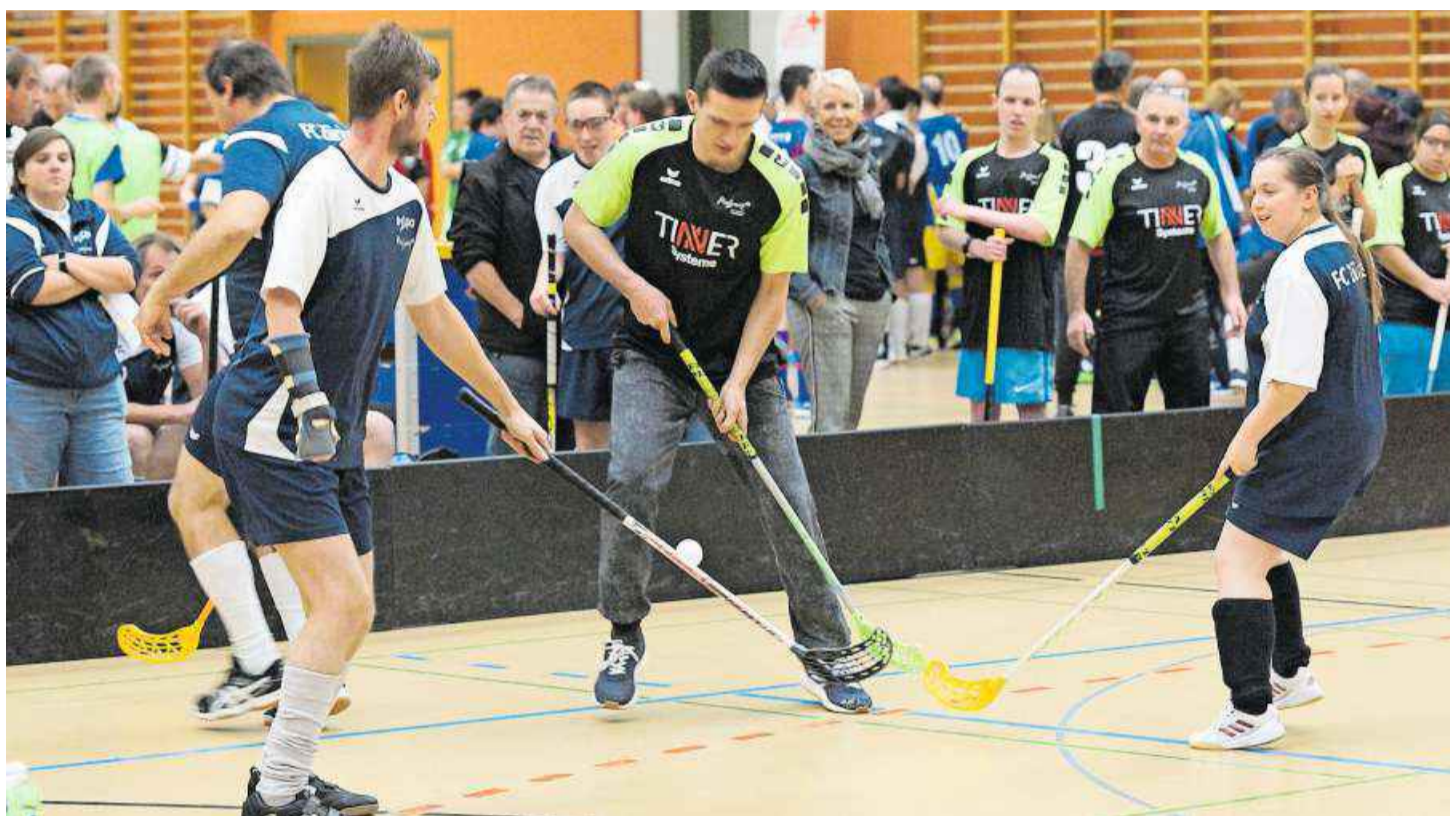
Nur den Ball im Blick: Der Stürmer der «Limmattaler Fighters» (schwarzer Dress) wehrt sich gegen eine Übermacht des «FC ZÜRSEE».