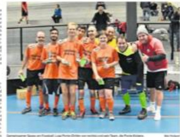
Teilnehmerinnen und Teilnehmer bei den Axpo-Plusport-Fussballturnieren.

Es freut mich, dass die Teilnehmerinnen und Teilnehmer bei den Axpo-Plusport-Fussballturnieren das Aargauer Sport- und Kurortzentrum Golfay mit Leben füllen, auch die Freude am Fussballspiel im Vordergrund.